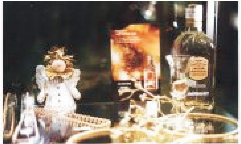
Goldschmiede Hansen, Etkrath