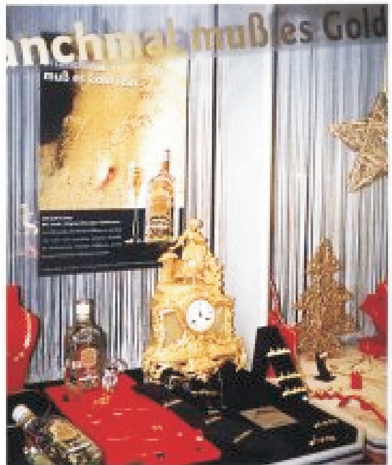
Goldschmiede Eckholt, Alpen